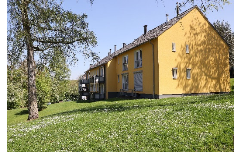
Idyllisch: Viel grün hinter den Häusern

Wir beraten Sie gerne persönlich zu allen Wohnungsangeboten, Fragen, auch zur WBS-Berechtigung und allen Service-Vorteilen für ein rundum gutes Wohngefühl.