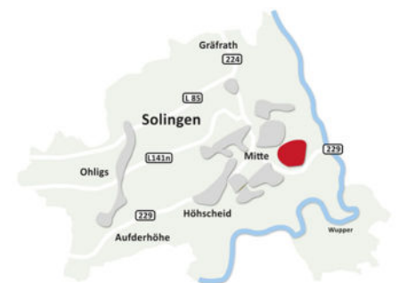
In Solingen-Mitte: Siedlung Klauberg | Wupperstraße