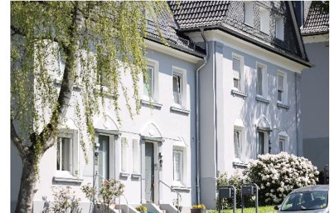
Siedlung Klauberg | Wupperstraße: Reizvoller Altbau