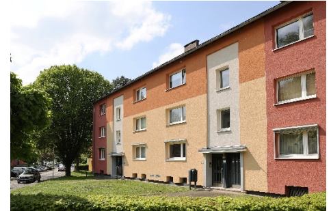
Siedlung IV Feld