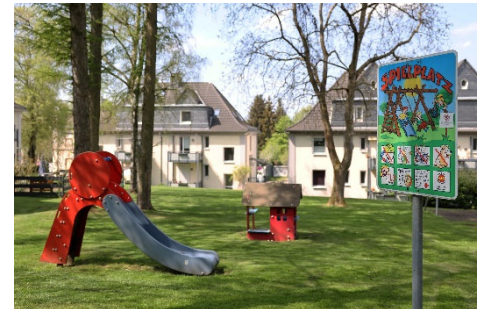
Großzügige Grünflächen für Spiel und Erholung

Wir beraten Sie gerne persönlich zu allen Wohnungsangeboten, Fragen, auch zur WBS-Berechtigung und allen Service-Vorteilen für ein rundum gutes Wohngefühl.