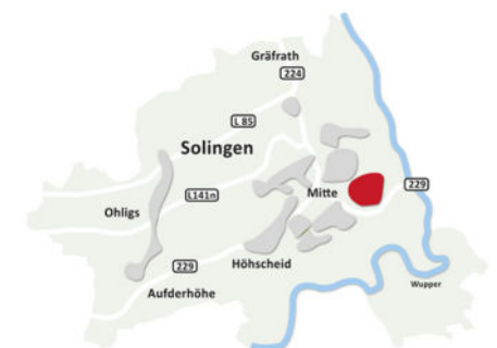
In Solingen-Mitte|Meigen: Siedlung IV Feld