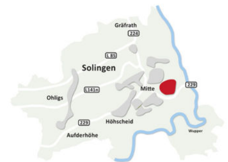
In Solingen-Mitte | Meigen: Siedlung Hacketäuerstraße