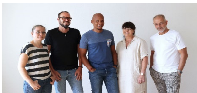
Ihr Team 3

Spar- und Bauverein Solingen eG · Gemeinnützige Wohnungsgenossenschaft Kölner Straße 47 · 42651 Solingen · Tel.: 02 12 / 20 66 - 830 Team-Wohnen3@sbv-solingen.de · www.sbv-solingen.de