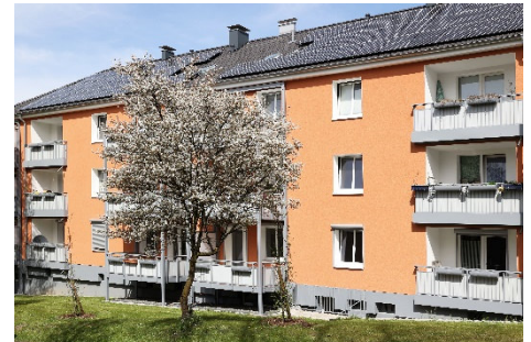
Siedlung Hacketäuerstraße: günstig für Familien