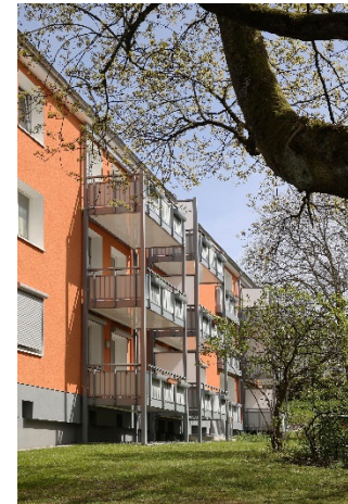
Spielfreundliche Grünflächen für die Kinder

Wir beraten Sie gerne persönlich zu allen Wohnungsangeboten, Fragen, auch zur WBS-Berechtigung und allen Service-Vorteilen für ein rundum gutes Wohngefühl.