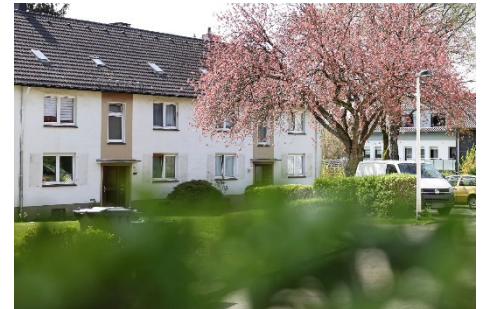
Idyllische Lage zum kleinen Preis