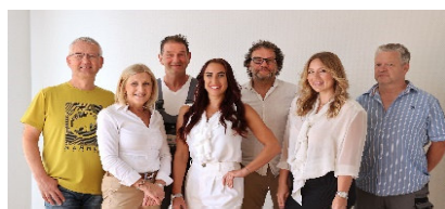
Ihr Team 1

Spar- und Bauverein Solingen eG • Gemeinnützige Wohnungsgenossenschaft Kölner Straße 47 • 42651 Solingen • Tel.: 02 12 / 20 66 - 810 Team-Wohnen1@sbv-solingen.de + www.sbv-solingen.de