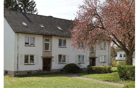
Siedlung Erfer Straße: ruhig und günstig wohnen