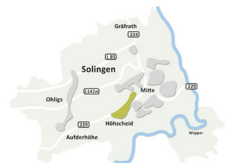
In Solingen-Höscheid: Siedlung Erfer Straße

Wir beraten Sie gerne persönlich zu allen Wohnungsangeboten, Fragen, auch zur WBS-Berechtigung und allen Service-Vorteilen für ein rundum gutes Wohngefühl.