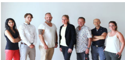
Ihr Team 2

Spar- und Bauverein Solingen eG · Gemeinnützige Wohnungsgenossenschaft Kölner Straße 47 · 42651 Solingen · Tel.: 02 12 / 20 66 - 820 Team-Wohnen2@sbv-solingen.de · www.sbv-solingen.de