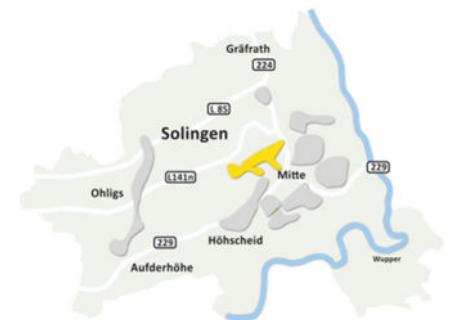
In Solingen-Mitte: Siedlung Cäcilienstraße